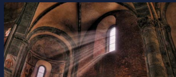
Particolare della navata laterale

Tornano in mostra le immagini della Sacra di San Michele realizzate da Franco Borrelli. Esposte nella foresteria, queste istantanee straordinarie e suggestive rivelano l'essenza dell'Abbazia. Un luogo davvero unico, a cui il fotografo dedicherà un nuovo, affascinante progetto