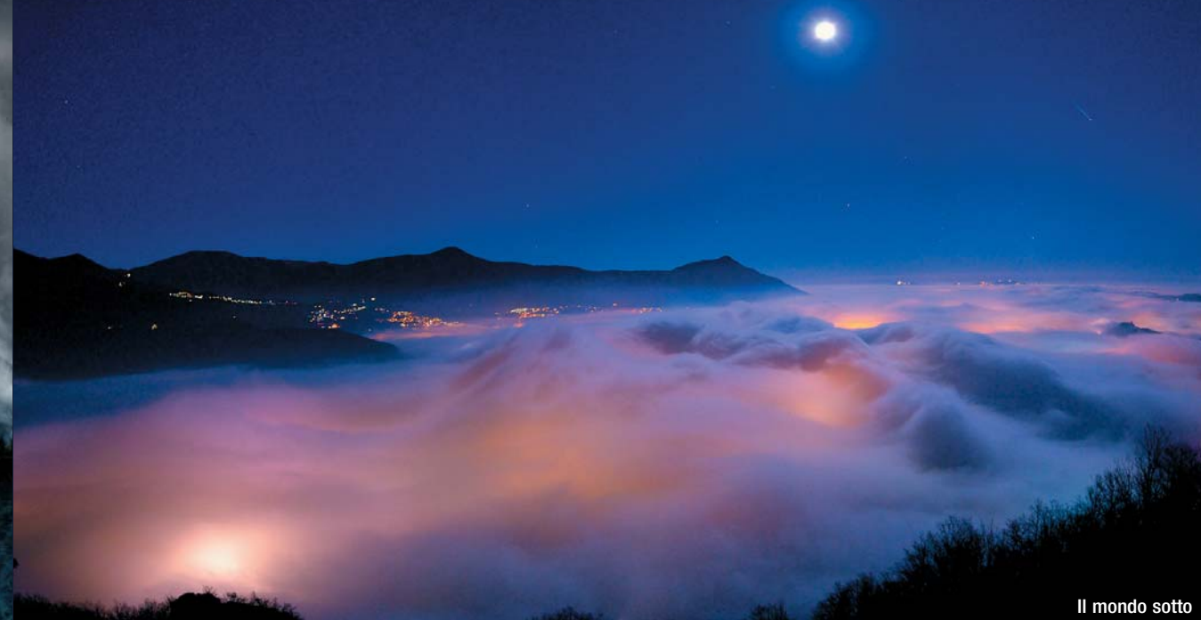
Il mondo sotto