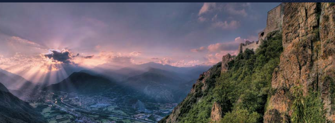
Vista sulla Val di Susa