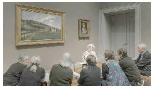
«Il quadro - Chicago»

Sono tutte orizzontali e di grande formato le immagini di Franco Borrelli in mostra da Abf/Scatola Chiara, una piccola galleria per la fotografia storica e contemporanea. Un artista che Torino conosce, tra i numerosi lavori, per le gigantografie degli insetti esposte al Museo di Scienze Naturali e per le campagne della Regione, di cui può finalmente apprezzare la sensibilità nel cogliere le emozioni più segrete degli uomini. Il titolo della mostra, «From inside», sottolinea la ricerca di Borrelli: in poco meno di due anni di lavoro ha voluto indagare il rapporto che l'uomo instaura non solo