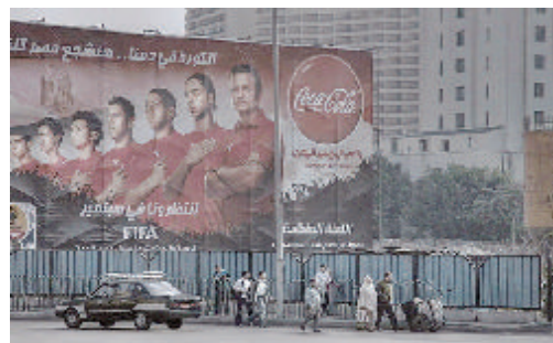
«Eroi - Il Cairo»