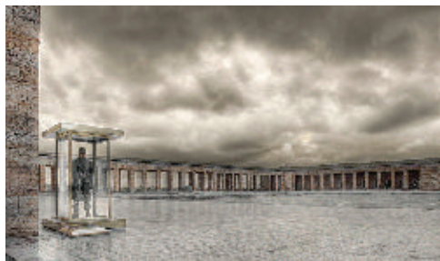
«Il soldato - Ankara»